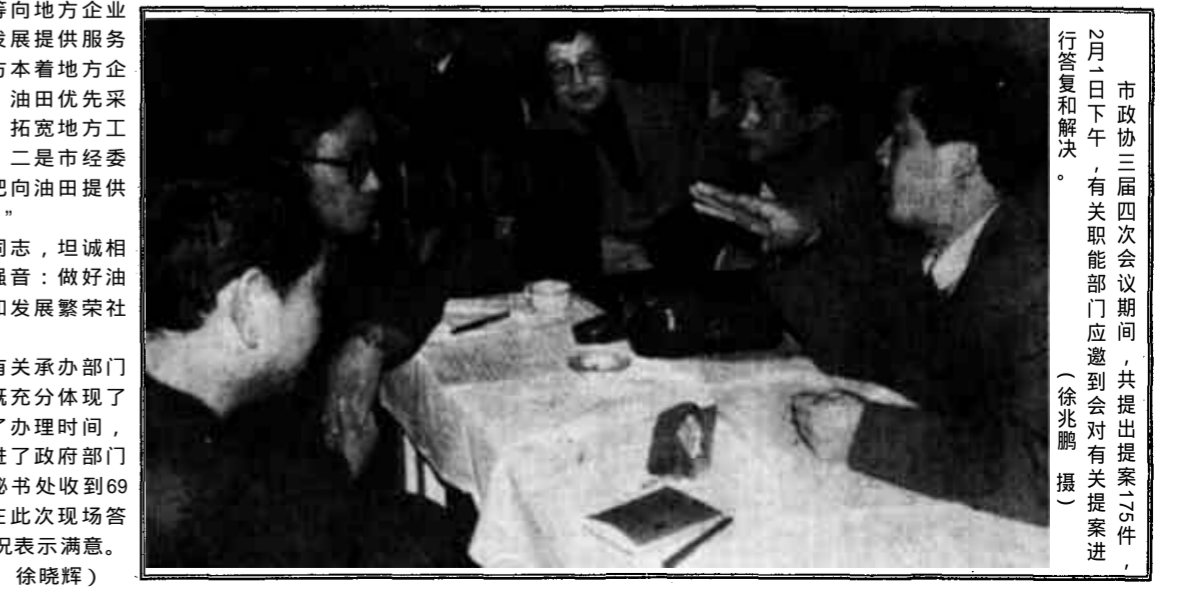
2月1日下午,市政协三届四次会议期间,共提出提案21件,有关职能部门应邀到会有关提案进行答复和解决。

在村里工作了三十余年的老村干部,也有为集体护堤看树几十载的八旬老人;还有在家庭缺乏劳力的情况下,毅然让位子光荣入伍的军属。参加慰问的五位同志逐户对他们进行了走访,仔细地看了他们的生活情况,并鼓励他们听党的话,勤劳致富。当市体委领导同志将百元现金和部分衣物分送到他们手中时,有的感动的泪流满面,有的连声说“共产党好,政府真好!”军属丁大嫂更是激动地追赶着向同志们口袋里塞糖,场面非常感人。