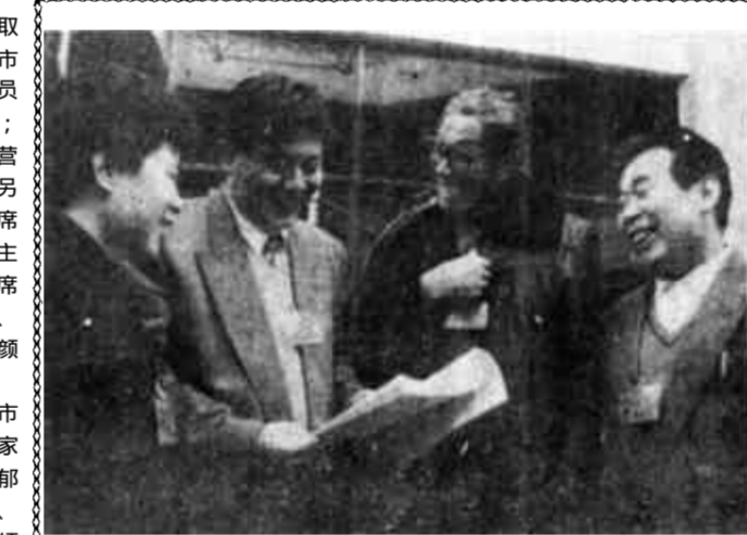
左图 实施“科教兴市”战略,大力发展科技教育事业,为加快经济发展提供人才和智力保证,这对来自基层的教育、卫生和企业界代表来说,他们的体会更深:说句心里话,我们凑到一起,谈论最多的就是这个话题。

市政协主席赵芳清主持了会议。副主席上官正昌、刘存吉、关美华、王效书、张源泉、刘杏元、颜捷先、周文龙、朱瑞、苏荣桂出席了会议。