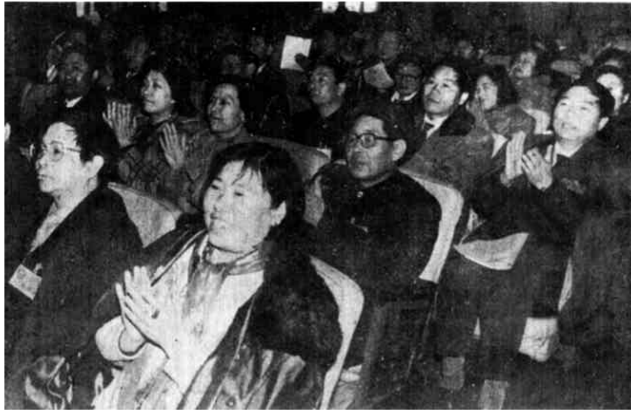
图为委员们鼓掌通过大会的各项决议。

本报讯 (记者 徐教连) 历时7天的中国人民政治协商会议第三届东营市委员会第四次会议,圆满完成了各项议程,于2月2日上午在西城宾馆胜利闭幕。